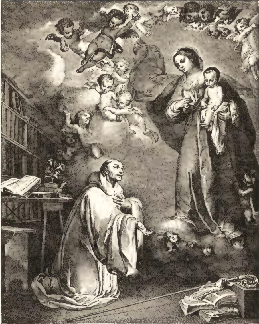
LA VIERGE APPARAISSANT A SAINT BERNARD. (Musée de Madrid.)